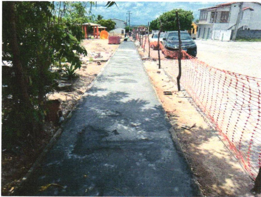
Foto 11 – PAVIMENTAÇÃO EM CONCRETO, COM ESPESSURA DE 7 CM, COM ACABAMENTO FEITO UTILIZANDO ALISADORA DE CONCRETO (HELICOPTERO), INCLUIDO TELA DE AÇO SOLDADA NERVURADA CA60, Q196 (3,11 KG/M 2 ), DIAMETRO DO FIO 5.0 MM, LARGURA = 2,45 M, ESPAÇAMENTO DA MALHA = 10 X 10 CM, JUNTA DE DILATAÇÃO EM PVC A CADA 2,00 M, CONCRETO FCK = 20 MPA