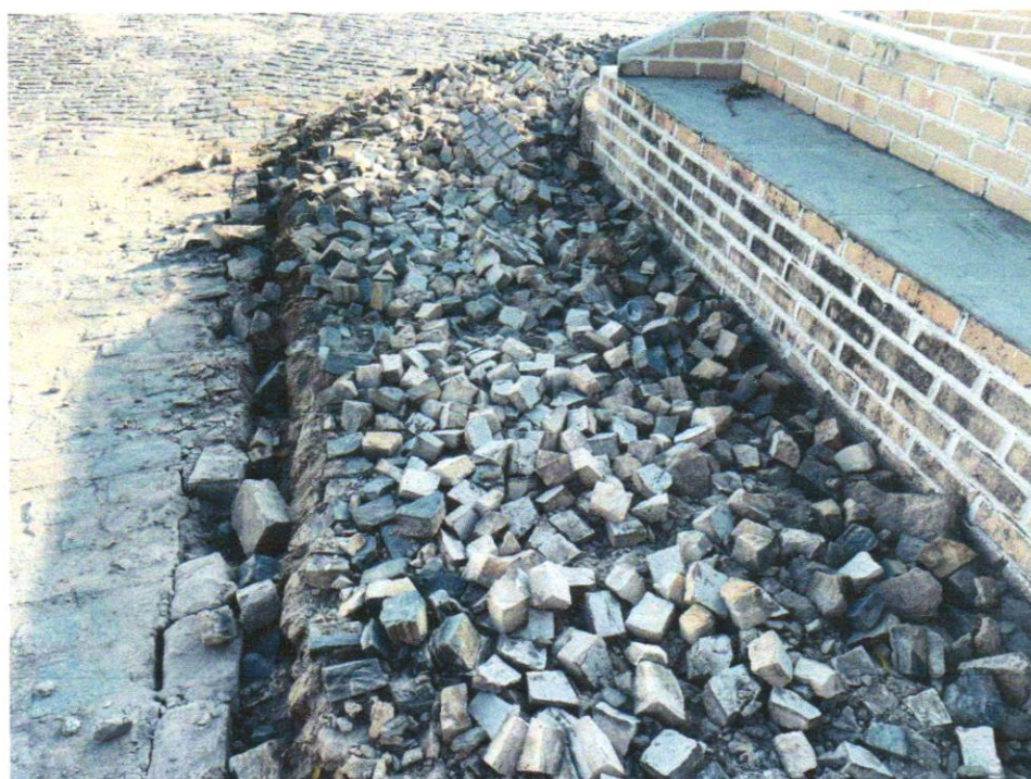
Foto 22 - Remoção de piso em Pedra Portuguesa