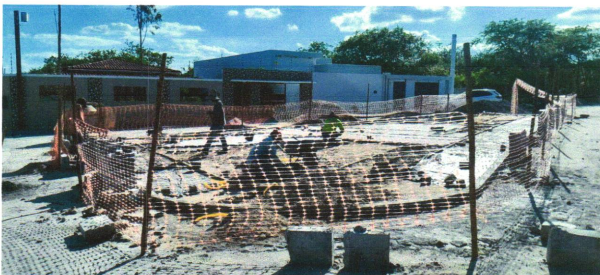
Foto 01 - Tapume de proteção em tela de polietileno h=1,20 com bloco de concreto