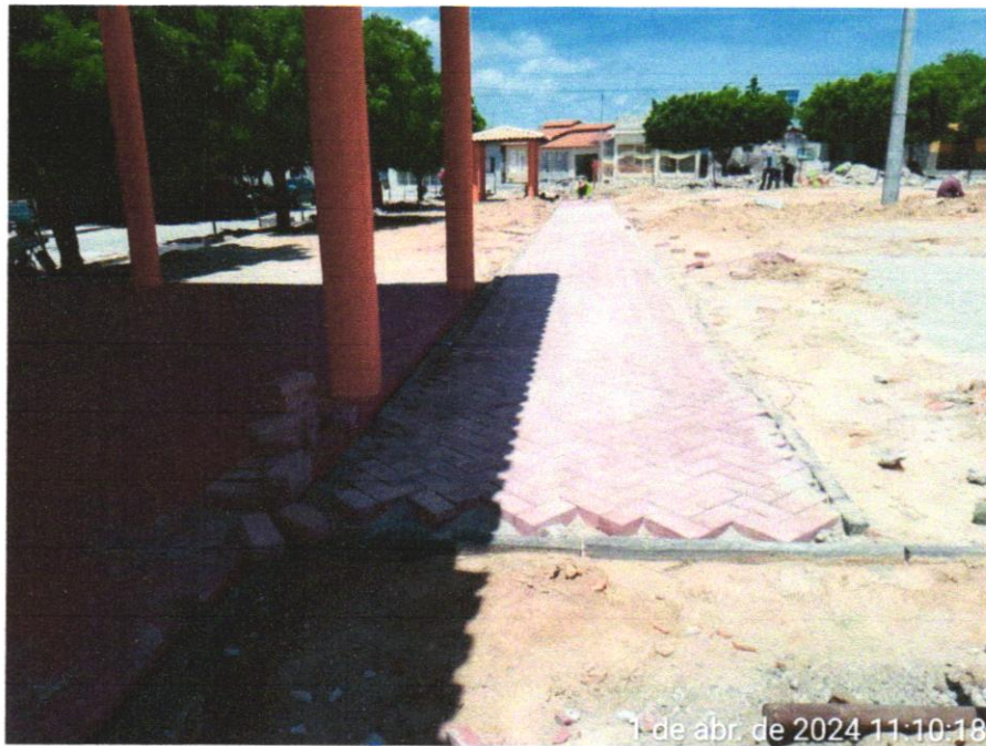
Foto 15 - Pavimentação em bloco de concreto vibroprensado, intertravado, colorido, 10x20cm, e=6cm, 46un/m 2 , NBR9781, Fck(min)=35MPa, sob coxim areia grossa compactada c/ placa vibratória, e(comp.)=6cm, rejuntado c/ areia fina.