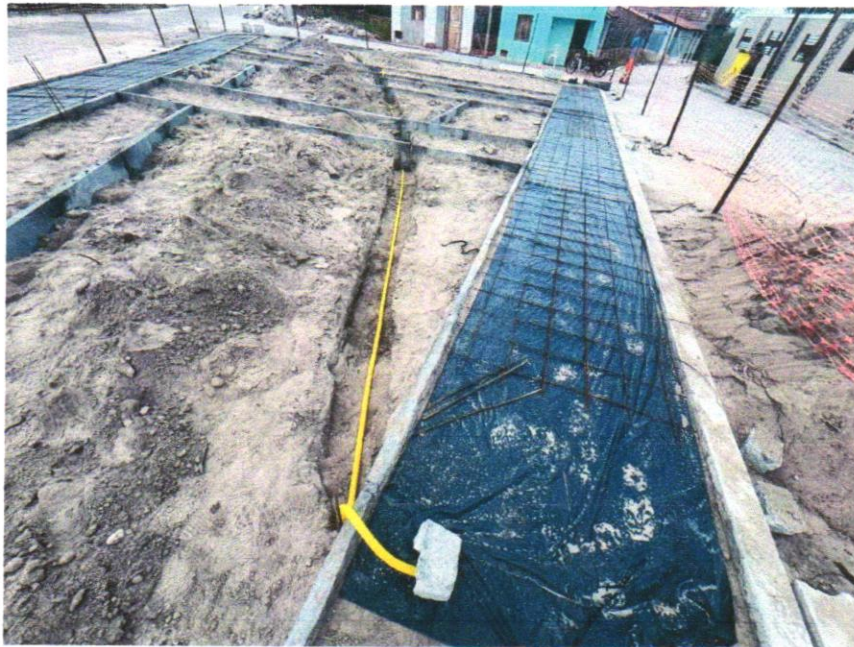
Foto 09 - ELETRODUTO