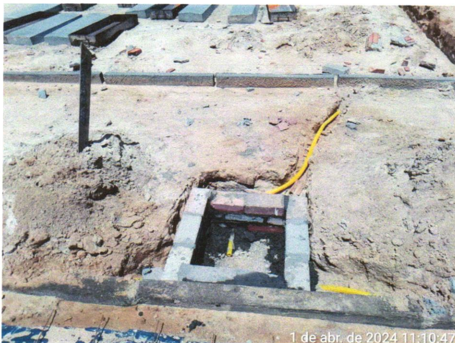
Foto 10 - CAIXA ENTERRADA ELÉTRICA RETANGULAR, EM ALVENARIA COM TIJOLOS CERÂMICOS MACIÇOS, FUNDO COM BRITA, DIMENSÕES INTERNAS: 0,3X0,3X0,3 M. AF_12/2020

Evaldo Almeida Moraes Engenheiro Civil RNP 051417303-3