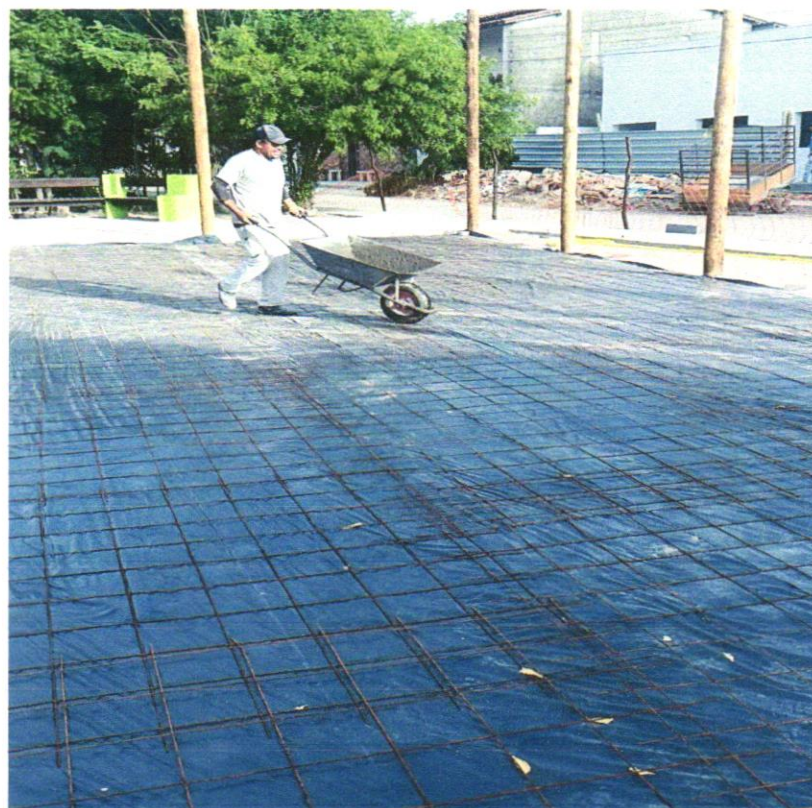
Foto 18 - FORNECIMENTO E INSTALAÇÃO DE TELA AÇO SOLDADA NERVURADA CA-60, MALHA 15X15CM, FERRO 4.2MM, PAINEL 2X3M, (1,50KG/M 2 ), MALHA POP REFORÇADA GERDAU OU SIMILAR

Evaldo Almeida Moraes Engenheiro Civil RNP 051419303-3