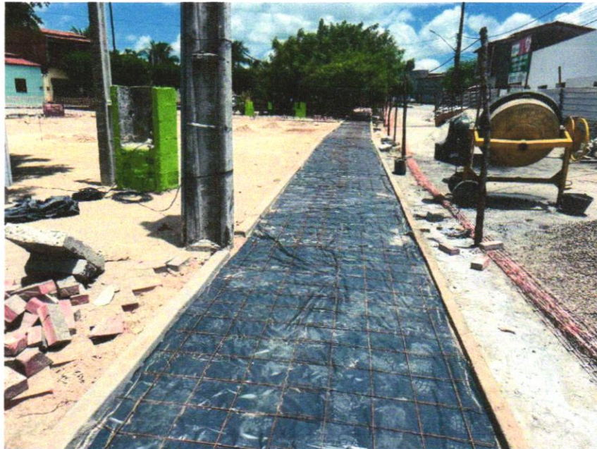
Foto 17 - APLICAÇÃO DE LONA PLÁSTICA PARA EXECUÇÃO DE PAVIMENTOS DE CONCRETO. AF_11/2017