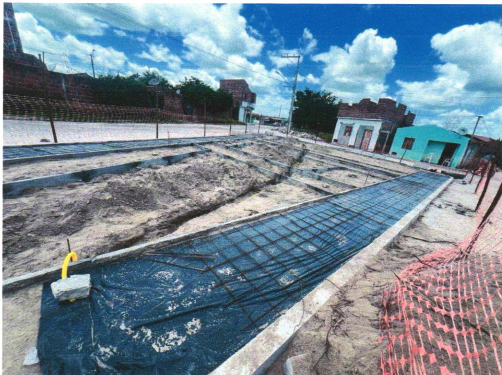
Foto 06 - ASSENTAMENTO DE GUIA (MEIO-FIO) EM TRECHO RETO, CONFECCIONADA EM CONCRETO PRÉ-FABRICADO, DIMENSÕES 100X15X13X20 CM (COMPRIMENTO X BASE INFERIOR X BASE SUPERIOR X ALTURA), PARA URBANIZAÇÃO INTERNA DE EMPREENDIMENTOS. AF_06/2016_P

Evaldo Almeida Moraes Engenheiro Civil RNP 051419303-3