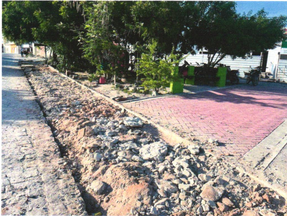
Foto 03 – RETIRADA DE MEIO-FIO DNER / ECONOMICO COM EMPILHAMENTO E SEM BOTA FORA