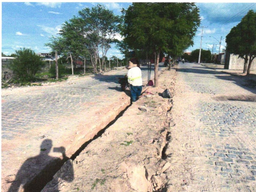
Foto 04 – ESCAVAÇÃO MANUAL DE VALA COM PROFUNDIDADE MENOR OU IGUAL A 1,30 M

Evaldo Almeida Moraes Engenheiro Civil RNP 051417303-3