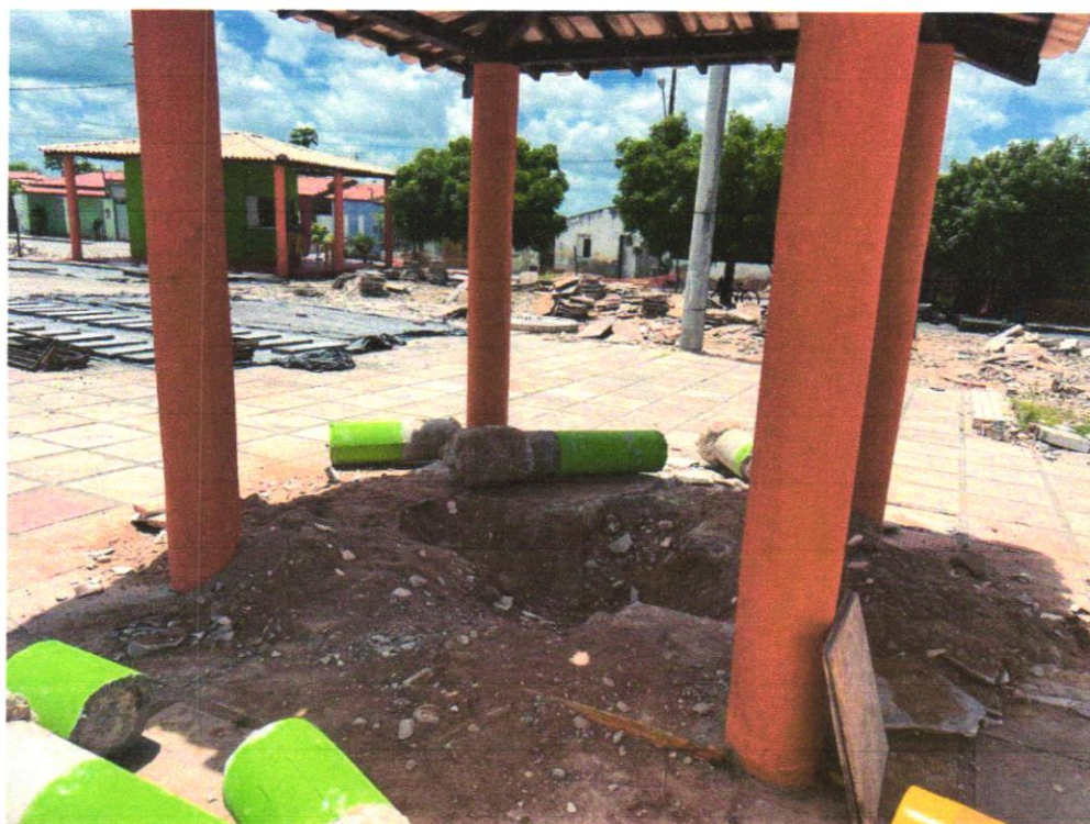
Foto 02 - Demolição de concreto manualmente