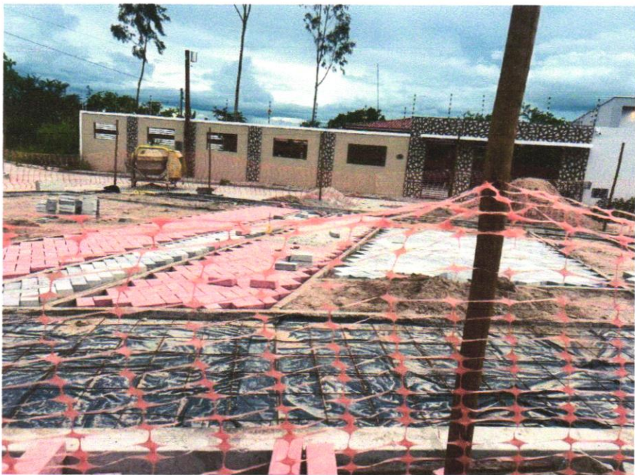
Foto 16 - Pavimentação em bloco de concreto vibroprensado, intertravado, colorido, 10x20cm, e=6cm, 46un/m 2 , NBR9781, Fck(min)=35MPa, sob coxim areia grossa compactada c/ placa vibratória, e(comp.)=6cm, rejuntado c/ areia fina.

Evaldo Almeida Moraes Engenheiro Civil RNP 05141V303-3