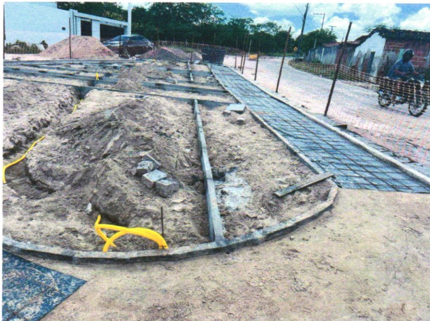
Foto 08 - ASSENTAMENTO DE GUIA (MEIO-FIO) EM TRECHO RETO, CONFECCIONADA EM CONCRETO PRÉ-FABRICADO, DIMENSÕES 80X08X08X25 CM (COMPRIMENTO X BASE INFERIOR X BASE SUPERIOR X ALTURA), PARA URBANIZAÇÃO INTERNA DE EMPREENDIMENTOS. AF_06/2016

Evaldo Almeida Moraes Engenheiro Civil RNP 051419303-3