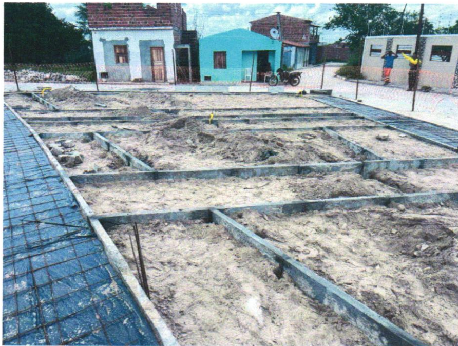
Foto 07 - ASSENTAMENTO DE GUIA (MEIO-FIO) EM TRECHO RETO, CONFECCIONADA EM CONCRETO PRÉ-FABRICADO, DIMENSÕES 80X08X08X25 CM (COMPRIMENTO X BASE INFERIOR X BASE SUPERIOR X ALTURA), PARA URBANIZAÇÃO INTERNA DE EMPREENDIMENTOS. AF_06/2016