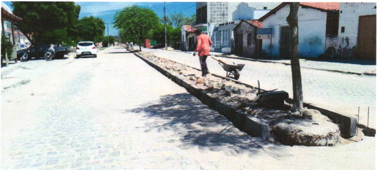
Foto 05 - ASSENTAMENTO DE GUIA (MEIO-FIO) EM TRECHO RETO, CONFECCIONADA EM CONCRETO PRÉ-FABRICADO, DIMENSÕES 100X15X13X20 CM (COMPRIMENTO X BASE INFERIOR X BASE SUPERIOR X ALTURA), PARA URBANIZAÇÃO INTERNA DE EMPREENDIMENTOS. AF_06/2016_P