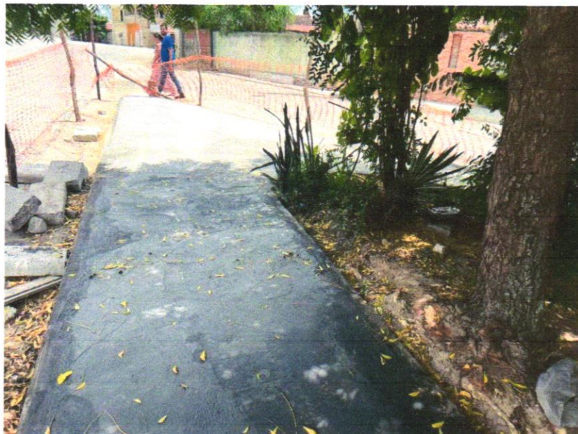
Foto 12 – PAVIMENTAÇÃO EM CONCRETO, COM ESPESSURA DE 7 CM, COM ACABAMENTO FEITO UTILIZANDO ALISADORA DE CONCRETO (HELICOPTERO), INCLUIDO TELA DE AÇO SOLDADA NERVURADA CA60, Q196 (3,11 KG/M 2 ), DIAMETRO DO FIO 5.0 MM, LARGURA = 2,45 M, ESPAÇAMENTO DA MALHA = 10 X 10 CM, JUNTA DE DILATAÇÃO EM PVC A CADA 2.00 M. CONCRETO FCK = 20 MPA

Evaldo Almeida Moraes Engenheiro Civil RNP 051417303-3