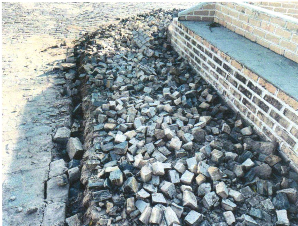
Foto 21 - Remoção de piso em Pedra Portuguesa